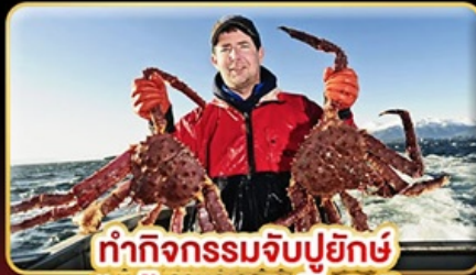
ทำกิจกรรมจับปูยักษ์ “พร้อมเมนูสุดพิเศษ”