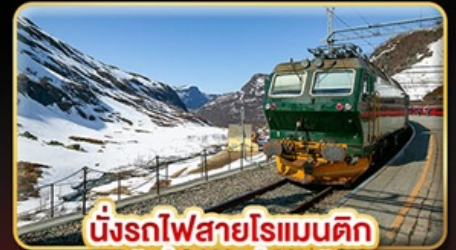
นั่งรถไฟสายโรแมนติก “พร้อมสปา”