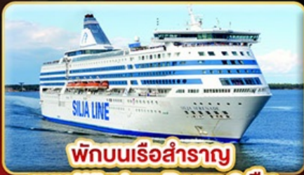
พักบนเรือสำราญ แบบ Window Room 2 คืน