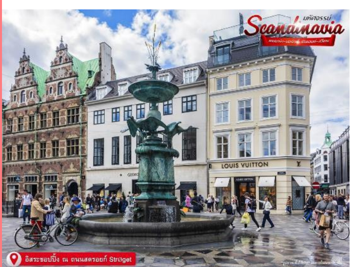
อิสระช้อปปิ้ง ณ ถนนสตรอยก์ Strøget

ให้ท่านได้ อิสระช้อปปิ้ง ณ ถนนสตรอยก์ (Strøget) ถนนคนเดินที่ยาวที่สุดในโลก ร้านบนถนนช้อปปิ้งสายหลักของเมืองนั้นเต็มไปด้วยแบรนด์ดังที่เราคุ้นเคยดี ตั้งแต่ Louis Vuitton ไปจน Urban Outfitter และ Zara ที่ไม่ว่าใครจะเข้ามาแล้วก็เมืองก็สาขา ก็ไม่สามารถหยุดขาตัวเองไม่ให้เดินเข้าไปซ้ได้ แต่ที่น่าสนใจมากกว่าคือ ร้านของแบรนด์ดีไซเนอร์ท้องถิ่นชื่อดัง อย่าง Wood Wood, Stine Goya, Henrik Vibskov ที่ตั้งอยู่บริเวณนี้เช่นกัน