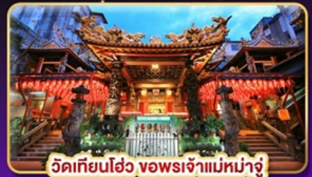
วัดเทียนฮั่ว ของพระเจ้าแม่หม่าจู