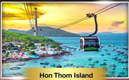
Hon Thom Island