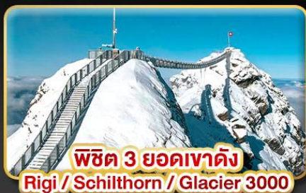
พิชิต 3 ยอดเขาดัง Rigi / Schilthorn / Glacier 3000