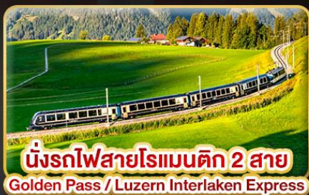
นั่งรถไฟสายโรแมนติก 2 สาย Golden Pass / Luzern Interlaken Express