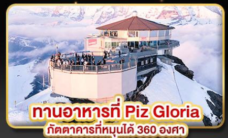
ทานอาหารที่ Piz Gloria ทัศนียภาพที่มุมได้ 360 องศา