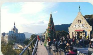
Gio Cafe Tam Dao