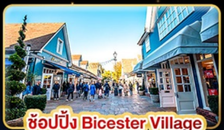
ช้อปปิ้ง Bicester Village