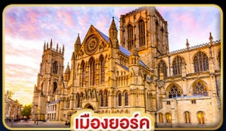
เมืองยอร์ก