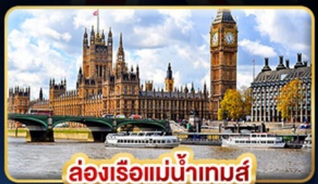
ล่องเรือแม่น้ำเทมส์