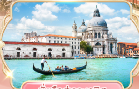
นั่งเรือสู่เกาะเวนิส