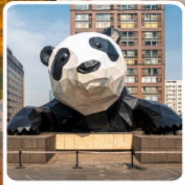
หมีแพนด้ายักษ์ป็นตึก