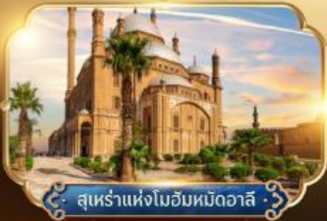
สุเหร่าแห่งโมฮัมหมัดอาลี