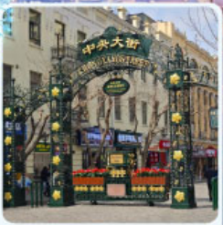
ถนนจงยาง