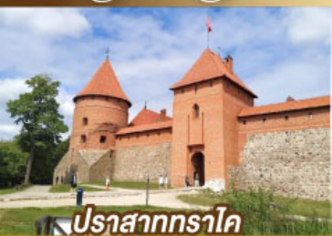
ปราสาททราโค