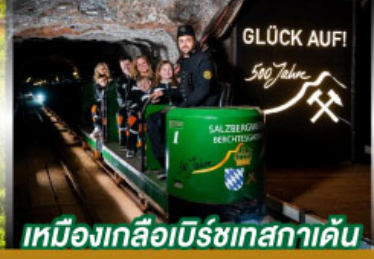
เหมืองเกลือเบิร์ชเทสกาเดิน