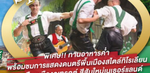
พิเศษ!! ทานอาหารค่ำ พร้อมชมการแสดงดนตรีพื้นเมืองสไตล์โรเลียน และเยือนเมืองอูเทรคต์ สีสันใหม่เนเธอร์แลนด์

ไฮไลท์โปรแกรม • เยือนเมืองแห่งแคว้นบาวาเรีย และ ทิโรล • สุกสนานเหมืองเกลือเบิร์ชเทสกาเดิน • เข้าชมปราสาทนอยชวานสไตน์ • เดินเล่นจัตุรัสโรเมอร์ ซอปปิง Zeil Street • ถ่ายรูปมุมสวยของหมู่บ้านอัลสติก • ซิลลา ไปในเมืองซาลสบูร์ก บ้านเกิดโมสาร์ท • ล่องเรือหมู่บ้านทีธูร์น และ ล่องเรือชมนครอัมสเตอร์ดัม • ซอปปิงจุ้ยย่านดิมสแควร์และเดินเล่นย่านโคมแดง 25 ก.ย. - 04 ต.ค. 69 09-18, 16-25 ต.ค. 69 22-31 ต.ค. 69 / 06-15 พ.ย. 69 29 ธ.ค. 69 - 07 ม.ค. 70 * ปีใหม่ *