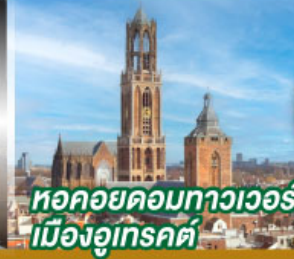
หอคอยคอกทาวเวอร์ เมืองอูเทรคต์