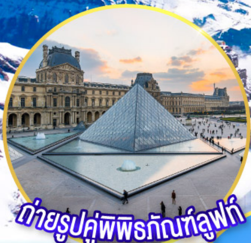
ถ่ายรูปคู่พีพีร์กันที่ลูฟร์