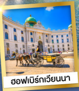
ออฟเบิร์กเวียนนา