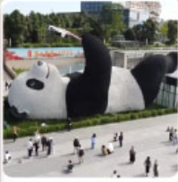
รูปปั้นแพนด้าเซลฟี