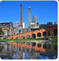
Eastern Suburb Memory Chengdu