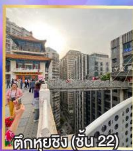
ตึกหุยซิง (ชั้น 22)