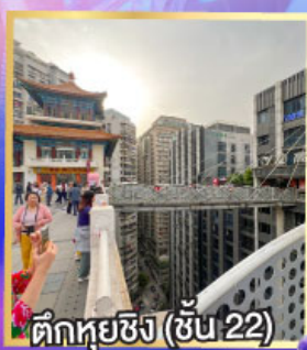
ตึกหุ่ยซิง (ชั้น 22)