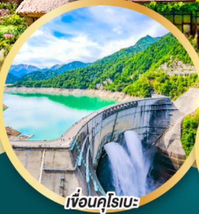
เพื่อนคู่โรเบะ