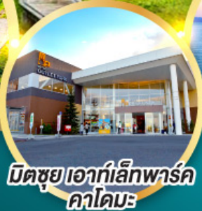
มิตรชยุ เอากีลีกพาร์ค คาโดมะ