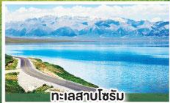
ทะเลสาบโซริม