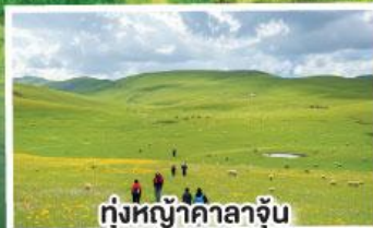
ทุ่งหญ้าคาลาจูน