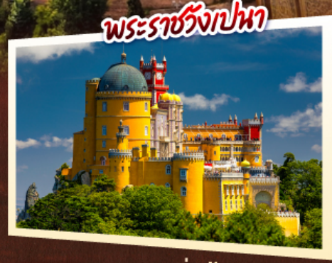
พระราชวังเปนา

เข้าชมความงดงามของ พระราชวังอัลมบราและพระราชวังเปนา