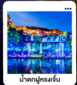
น้ำตกฝูหลงเจิน

"มหัศจรรย์...จางเจียเจีย" | ดินแดนแห่งขุนเขาและสายน้ำ "เขาเทียนเหมินซาน" | ประตูล่องเรือ...ท่ากายศรึกษา 999 ชั้น | นั่งรถไฟความเร็วสูง สัมผัสความสวยงามระบือขงแกว "อุทยานอวตาร" | ล่องลอยกลางขุนเขา...ดั่งภาพฝันในห้วงเวลายเจียเจีย | ช้อปปิ้ง POPMART "เมืองโบราณ"ฝูหลง" หยุคเวลา ณ เมืองบนม่านน้ำตก... | "เฟิ่งหวง" ล่องเรือชมชีวิตริมแม่น้ำกิวเจียง "นครอางซา" ปิดท้ายความก้นสมัย