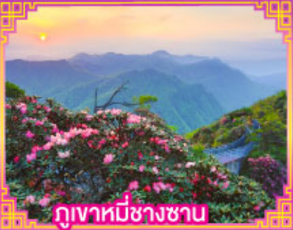
ภูเขาหมีชางซาน