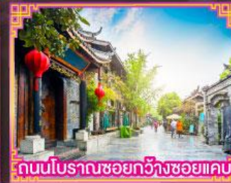
ถนนโบราณชอยกวางชวยเคบ