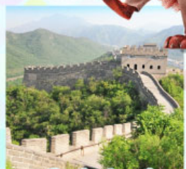
กำแพงเมืองจีนด่านจวิ๊ยงกวน