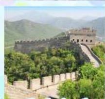
ตลาดร้อยปีเจิ้งหวงเมี่ยว กำแพงเมืองจีน ด้านจวิ๋ยงกวน