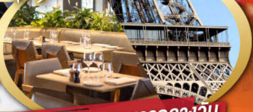
รับประทานอาหารกลางวัน บนหอคอยไอเฟล

ไฮไลท์ในโปรแกรม • ถ่ายรูปหอคอยไอเฟลและพิพิธภัณฑ์ลูฟว์ • สะพานไม้ชาเปล ลูเซียน • ขึ้นกระเช้าสู่ยอดเขาจุงเฟรา • เมืองมรดกโลก กรุงเบิร์น • ถ่ายรูปปราสาทชิลยงที่มองเทรอซ์ • ศาลาไทย เมืองโลซานน์ • เดินเพลินๆ ณ เมืองเวเวย์