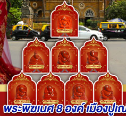
พระพิฆเนศ 8 องค์ เมืองปูเน่

" อินเดียครั้งนี้ ไม่ใช่แค่ทริป แต่คือการเปลี่ยนแปลง ปลุกพลังในตัวคุณ... ด้วยพิธีกรรมศักดิ์สิทธิ์ ณ สถานที่จริง ของพระพิฆเนศ ดินแดนแห่งปัญญาและพรสูงสุด"