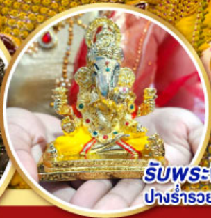
รับพระพิฆเนศวร ปางรำรอย ท่านละ 1 องค์