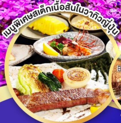
เมนูพิเศษเสิร์ฟเนื้อสดในวากิวญี่ปุ่น

พัทช์ชิโร 2 คืน ระดับ 4 ดาว ใกล้แหล่งช้อปปิ้ง