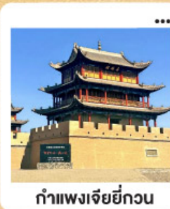
กำแพงเจียยี่กวน