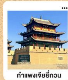
กำแพงเจียยี่กวน