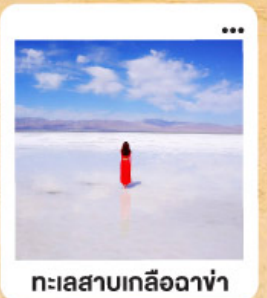
ทะเลสาบเกลือฉางซ่า