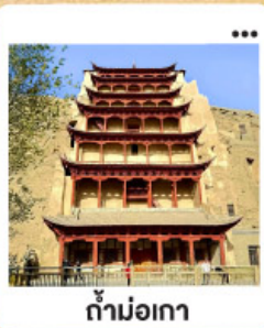
ถ้ำม่อเกา