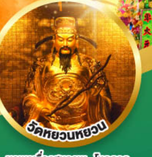
วัดหยวนทวยวน ขอพรเรื่องสุขภาพ, โชคลาภ ความเจริญก้าวหน้า

เมนูพิเศษ! ต้มช่าฮ่องกง, บุฟเฟ่ต์ซาบู่สไตล์ฮ่องกง, ห่านย่าง