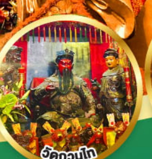
วัดกวนโก ขอพรเทพเจ้ากวนอู เงินทอง, ธุรกิจมั่นคง