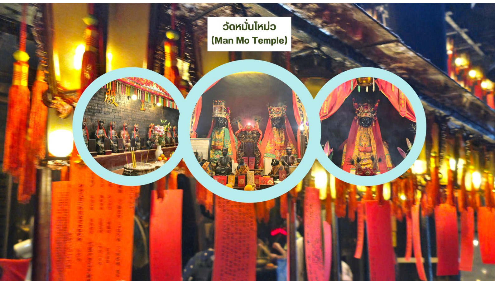
วัดหมั่นโหม่ว (Man Mo Temple)