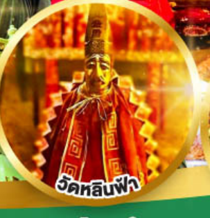
วัดหลินฟ้า ขอพรเสริมโชคลาภในธุรกิจ และการเงิน