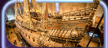
พิพิธภัณฑ์เรือเก่า

เยือนคาบสมุทรสแกนดิเนเวีย ดินแดนแห่งยุโรปเหนือ ชมความงามสุดอลังการที่สุดมหัศจรรย์ สถาปัตยกรรม โบสถ์เก่าเพสซิวคิโอ อาสนวิหารออสลอสก๊อท อนุสาวรีย์เซเบลิวส พิพิธภัณฑสถานประวัติศาสตร์เฮลซิงกิ เยี่ยมชมพิพิธภัณฑ์เรือเก่า ศาลาว่าการสตอกโฮล์ม ย่านเมืองเก่า Gamla Stan ถ่ายภาพ Oslo Opera House สวนมนุษย์ชาติ Vigeland ป้อมปราการอาครัสยูล มหาวิหารออสโล เซ็กซ์เลนคัมมาร์คน้ำพุเทพีออน รูปปั้นนางเงือก พระราชวังมาเลียบบอร์ก พระราชวังคริสเตียนบอร์ก ย่านดิงย่านนูฮวานน์ ซุปป์ิงเจสปลานาติ ถนนคนเดิน Strøget