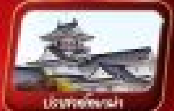
ปราสาทโทซากาชิ

เดินทาง 15 - 19 ต.ค. 69 / 5 - 9 พ.ย. 69 12 - 16 พ.ย. 69 / 26 - 30 พ.ย. 69 17 - 21 ธ.ค. 69