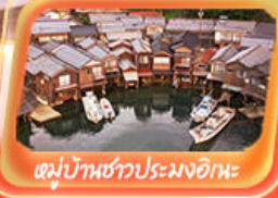
หมู่บ้านชาวประมงอิซะ