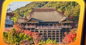
วัดคิโยมิสุเดระ