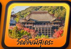
วัดคิโยมิสุเดระ

พักฟูจิออนเซ็น 1 คืน กิฟุ 1 คืน โทยาม่า 1 คืน นาริตะ 1 คืน