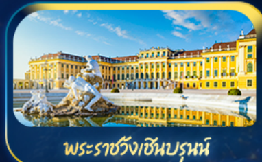
พระราชวังเซินบรูน์