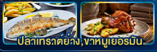
ปลาเทราต์ย่าง, จานหมูเยอรมัน