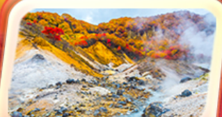
เขมเขานรกจิโศดานิ