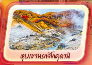
เขมเขานรจิกูดานิ