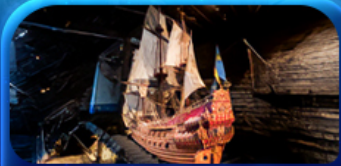
พิพิธภัณฑ์ทัวซ่า

Scandinavian Lover Capital Sweden Norway Denmark