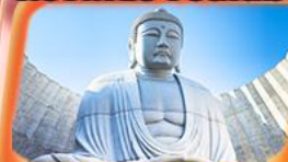
นินพระพุทธรเจ้า