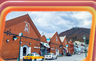
โด่งอิรุแดง

สายการบิน Thai Airways (TG) น้ำหนักกระเป๋า 23 KG