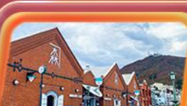
โถงอิฐแดง

สายการบิน Thai Airways (TG) น้ำหนักกระเป๋า 23 KG