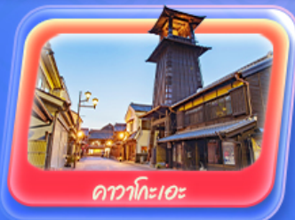
คาวาโกเอะ