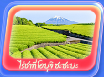
ไร่ชาที่โอบุจิ ชะชะปะ

ฟูจิออนเซ็น 1 คืน โตเกียว 1 คืน นาริตะ 1 คืน