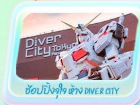
ช้อปปิ้งจูกอ ด้าง DIVER CITY