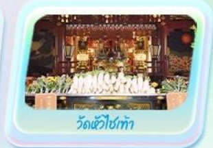
วัดหัวโขน