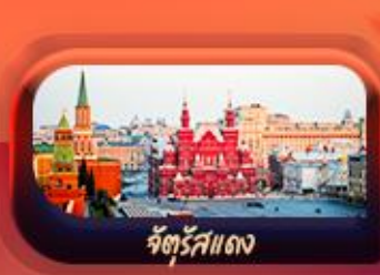
จัตุรัสแดง