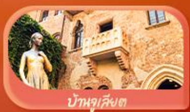
บ้านกุสเกต