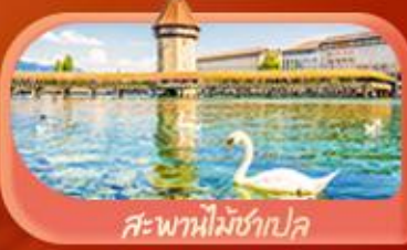
สะพานไม้ข่าปก

Highlight เยือนหมู่บ้านแสนสวยเซอร์แมท เช็กอินศาลาไทยสุดงามที่โลซาน เที่ยวลูเซิร์น ชมสะพานไม้ข่าเปลและอนุสาวรีย์สิงโต ซาลี แอปลิน ชมประติมากรรม The Fork และปราสาทซิลลองริมทะเลสาบ เยือนมิลาน มหาวิหารดูโอโม ที่ยเวนิส เมืองลอยน้ำสุดโรแมนติก อินกับรักอมตะที่บ้านจูเลียต และช้อปปิ้งจุใจที่ Serravalle Outlet