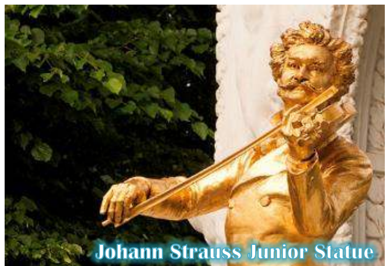
Johann Strauss Junior Statue

เช้า บริการอาหารเช้า ณ ห้องอาหารของโรงแรม นำท่านออกเดินทางเข้าสู่ใจกลาง “กรุง เวียนนา” (Vienna) ผ่าน“ถนนวงแหวน” Ring Strasse ซึ่งเป็นที่ตั้งของ โรง อوبرาการ (โอเปราเฮาส์), พระราชวังฮอฟบวร์ก, อาคาร รัฐสภา, ศาลาว่าการ, มหาวิทยาลัยเวียนนา, โบสถ์ประจำเมือง, ศาลสูง ฯลฯ เดินทางสู่ “สวนสาธารณะสตัดท์ปาร์ค” สวนสาธารณะอัน ร่มรื่นใจกลางเมือง ชม “อนุสาวรีย์ โยฮัน สเต ร่าส์ จูเนียร์” Johann Strauss ศิลปินที่มี ชื่อเสียงก้องโลก