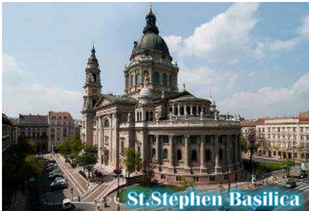
St. Stephen Basilica