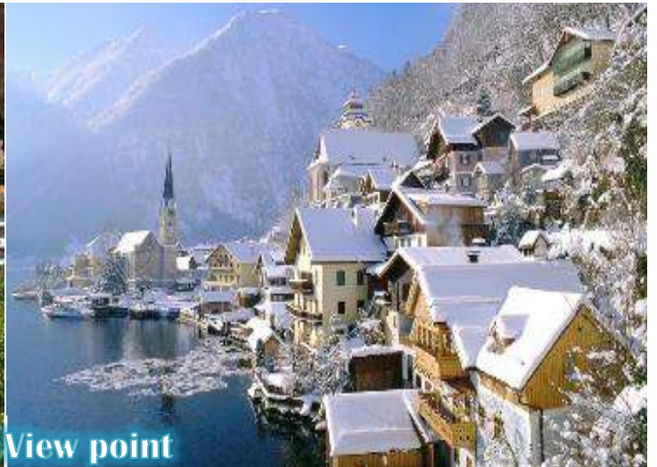
Hallstatt View point