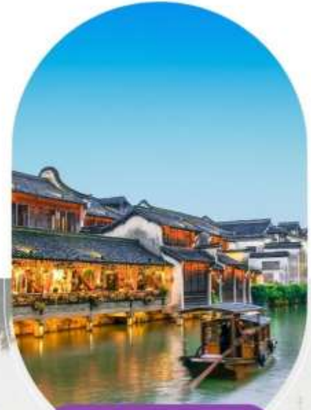
เมืองโบราณอู่เงิน