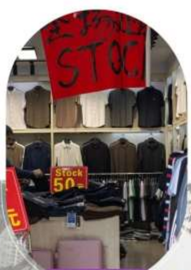
ตลาดค้าส่งอู่