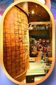
ร้านสตาร์บัคส์