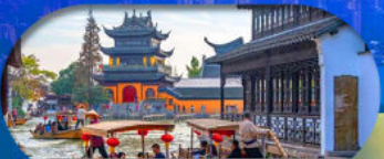
Zhujiajiao Ancient Town ล่องเรือเมืองโบราณ

เซี่ยงไฮ้ ดิสนีย์แลนด์ เมืองโบราณจูเจียเจียว