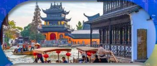
Zhujiajiao Ancient Town ส่องเรือเมืองโบราณ

เชียงใหม่ ดิสนีย์แลนด์ เมืองโบราณจูเจียเจียว