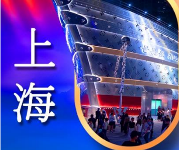
เรืออะทลันติก