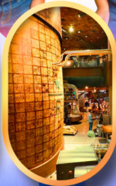
ร้านสตาร์บัคส์