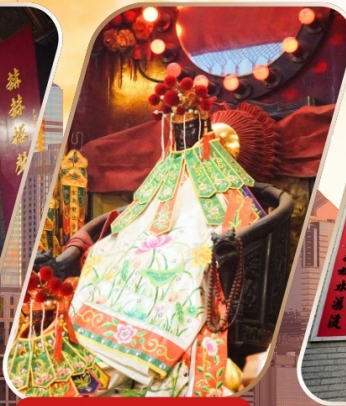
KWAN YUM HH