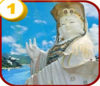
รีพลัสเบย์