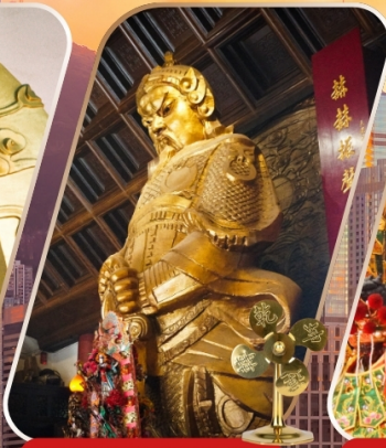
CHE KUNG (SHA TIN)