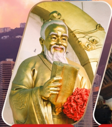
WONG TAI SIN