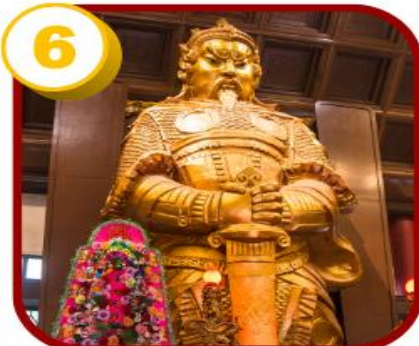
วัดแซกง (ซ่าถิ้น)