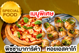
พิซซ่ามาริตต้า หอยยอสคาโก้