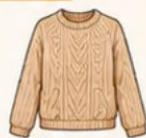
เสื้อไหมพรม