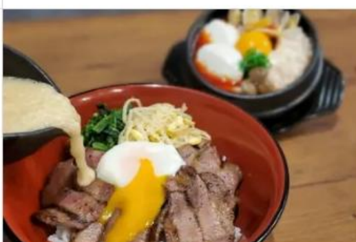
Gourmet MUGITORO & HAN