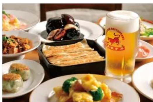
Gourmet BENITORA GYOZABOU

นำท่านเดินทางสู่ AEON TOWN SHOPPING MALL ท่านสามารถอิสระซื้อสินค้าทั่วไปของญี่ปุ่นเช่น ขนม, อาหารว่าง, ของเล่น, กระเป๋า, รองเท้า, เสื้อผ้า