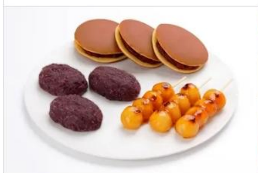
Gourmet KAKIYASU Kofukudo