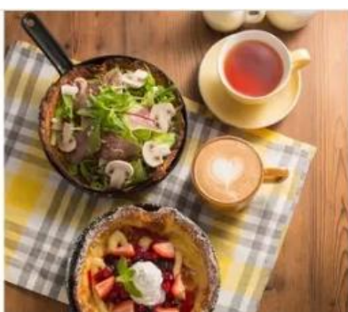
Gourmet Grace Garden Nature