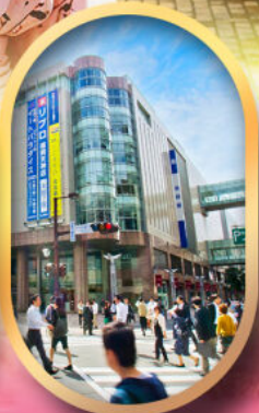
ช้อปปิ้งย่านเท็นจิน