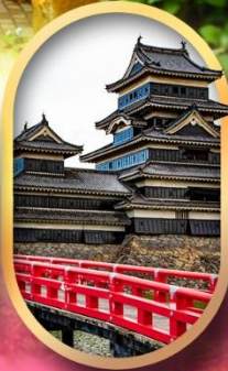
ปราสาทคумаโมโตะ