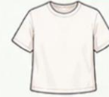
เสื้อยืด