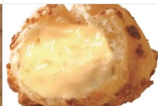
Gourmet Beard Papa