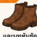
และบูทหุ้มข้อ