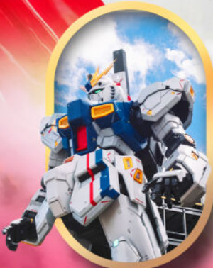
ห้างลาลาพอกันดั้ม