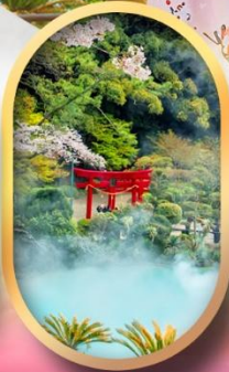
อุโมงิโกคุ