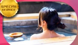
ที่พักดี อาหารดี