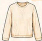
เสื้อแขนยาว