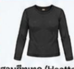
สวมฮีทเทค (Heattech) แบบหนาพิเศษด้านใน