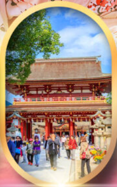
ศาลเจ้าคาโซฟู