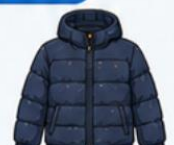
เสื้อขนเป็ด