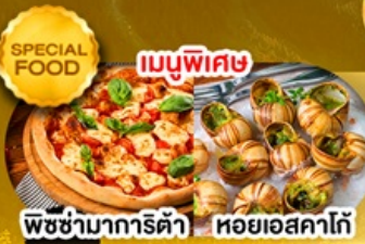
พิซซ่ามาการิตต้า หอยยอสคาโก้