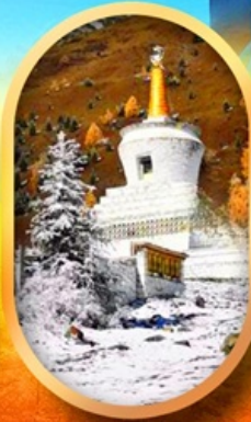
อุทยานสี่ครุณี