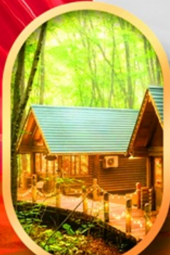
นิงเกิ้ลทอรัส