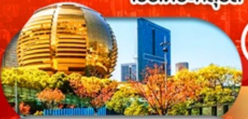
City Balcony จุดชมวิวชื่อดังในทางโจว

เชียงใหม่ หางโจว ดิสนีย์ สวนสนุกเลโก้แลนด์