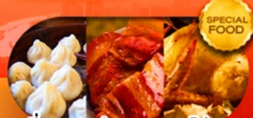
เมนูเสี่ยวหลงเปา หมูตงพ้อ ไก่จอกาน เดินทาง มี.ค. - มี.ย.69