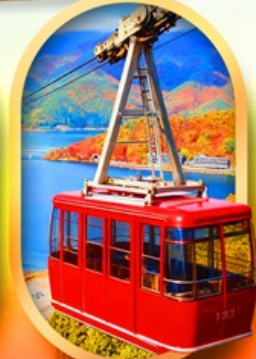
ขึ้นกระเช้าทะเลสาบมิกะตะ