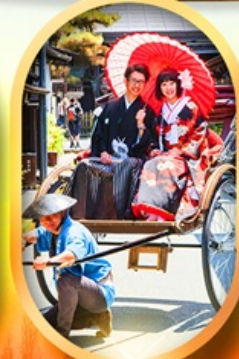
เมืองเก่าทาคายามา